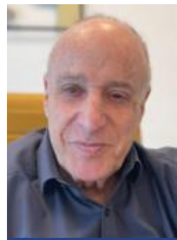
מאת עו"ד ג'ון גבע

בבית המשפט לתביעות קטנות בתל אביב יפו נדונה תביעתו של ר. ה. (התובע) נגד מנורה מבטחים ביטוח (הנתבעת). פסק הדין ת"ק 46882-10-24 מפי הרשם הבכיר רון פוליאק ניתן ב-9 במרץ 2025.