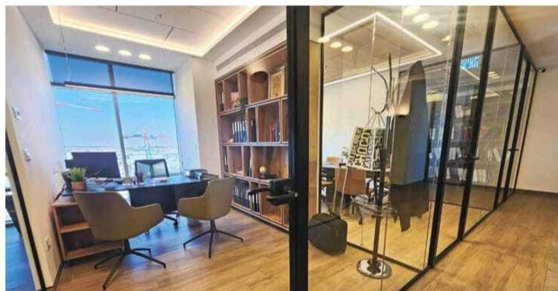
משרדי אנה פולישוק-קוסא

"מה שמנחה אותי לאורך כל הדרך הוא שמירה על אמות מידה מוסריות, שקיפות ואמינות. אלו הערכים שהולכים איתי לאורך כל חיי האישיים והקריירה המקצועית שלי ועליהם אני לא מוכנה להתפשר"